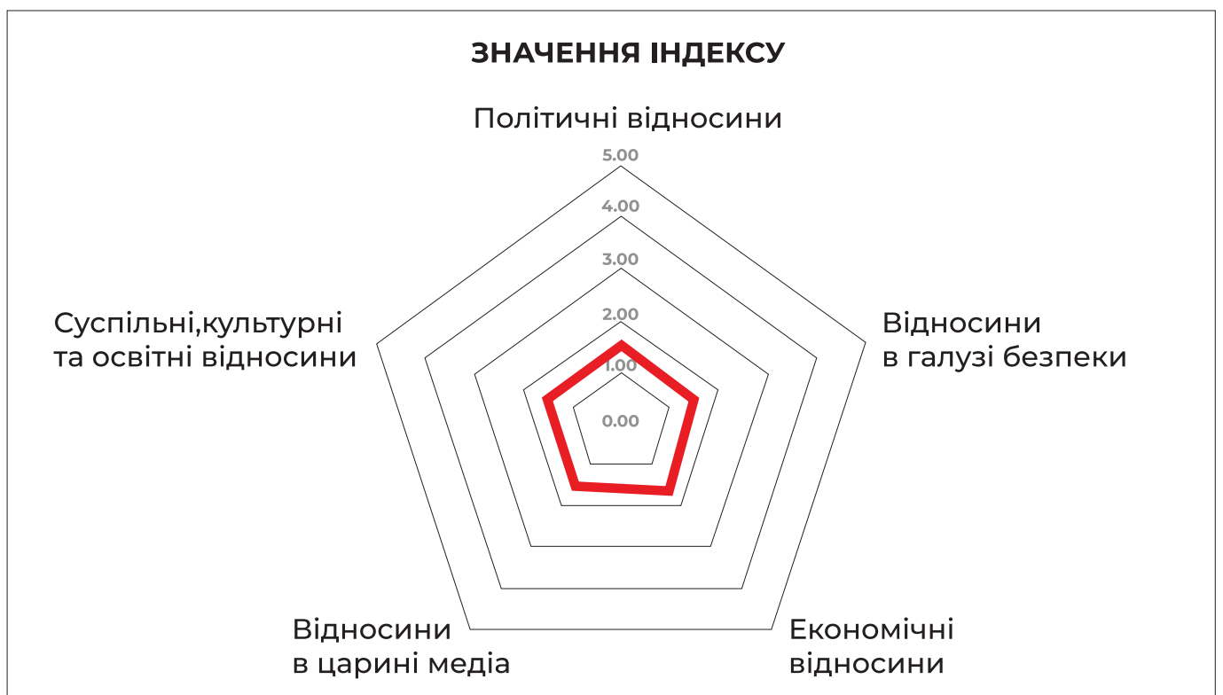
Рис. 2. Значення індексу за групами відносин