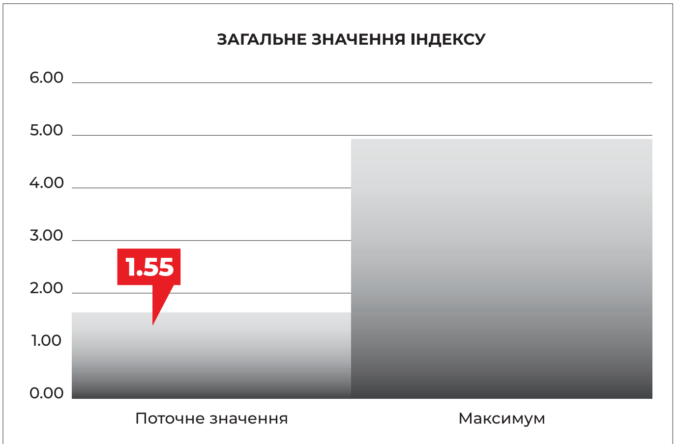
Рис. 1. Значення індексу